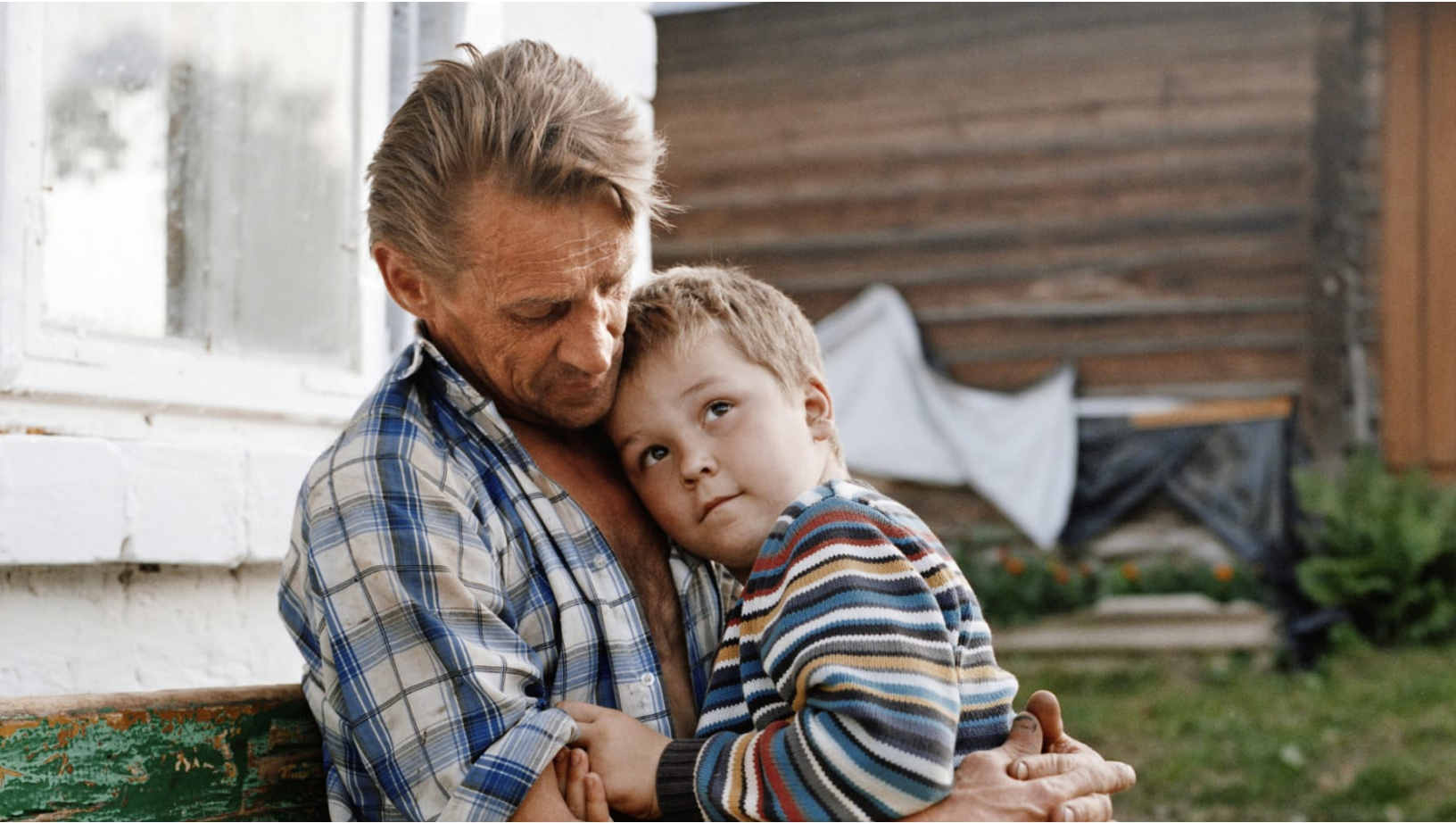
Father and son. Turgeliai, Šalčininkai district. 2015