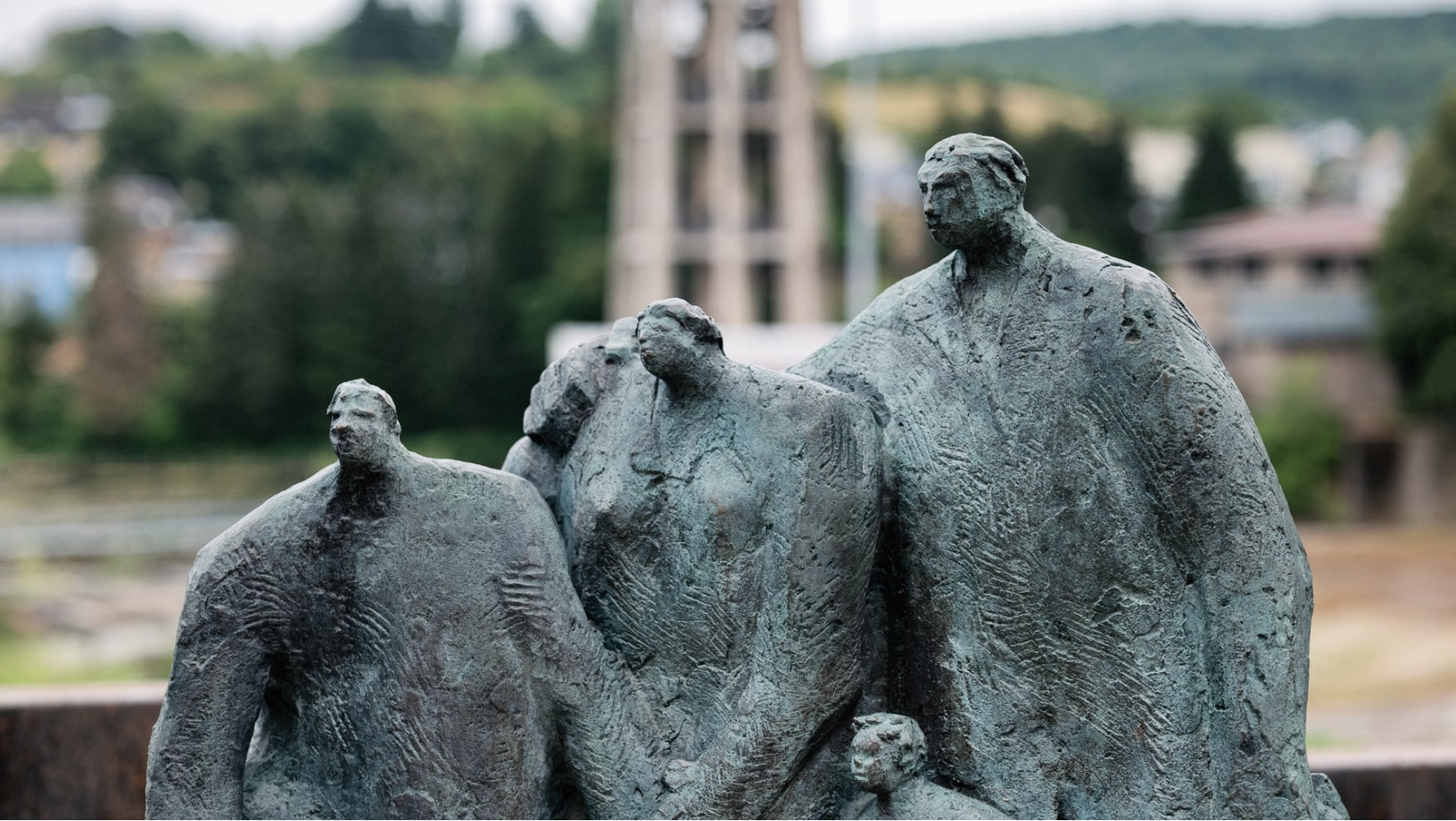
Musée The Bitter Years (Waassertuerm + Pomhouse)